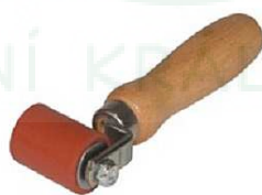
Roller - Silikonový váleček