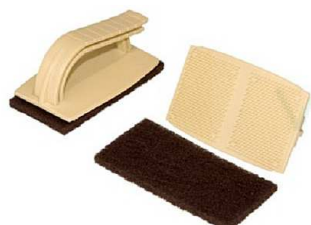
Rukojeť na stěrku Stěrka na lepidlo